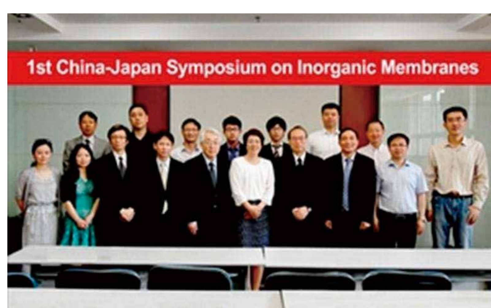
海外調査活動(南京工業大学)