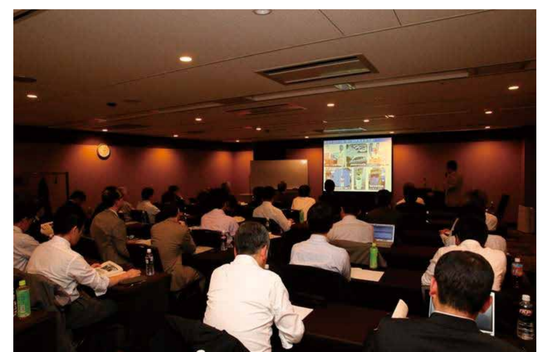
会員限定セミナー