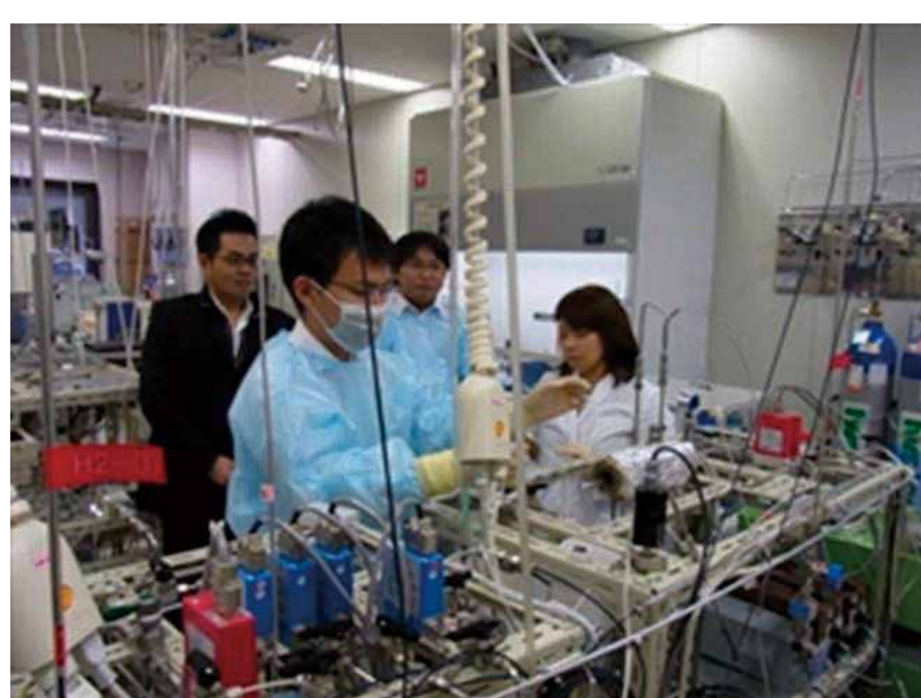
研修会 (講義、試作・評価等の実験)